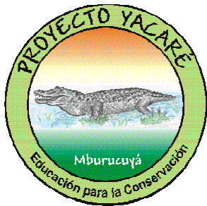
Logo diseñado por los alumnos ganadores del concurso

Este proyecto educativo viene desarrollándose en la Provincia de Buenos Aires, fue expuesto con la intención de mostrar la situación de una especie en grave peligro de extinción: el Venado de las Pampas , el cual en otro periodo tuvo una distribución hasta el norte de Argentina, incluida la provincia de Corrientes.